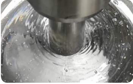
DESGASIFICACIÓN DE RESINA

Objetivos de la aplicación del vacío en la industria de metalizado al vacío (vacuum coating):