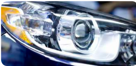
PREPARACIÓN DE RESINAS AL VACÍO